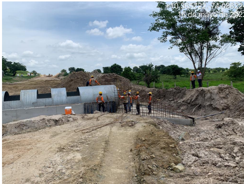
Figura 2. Obra Hidráulica.