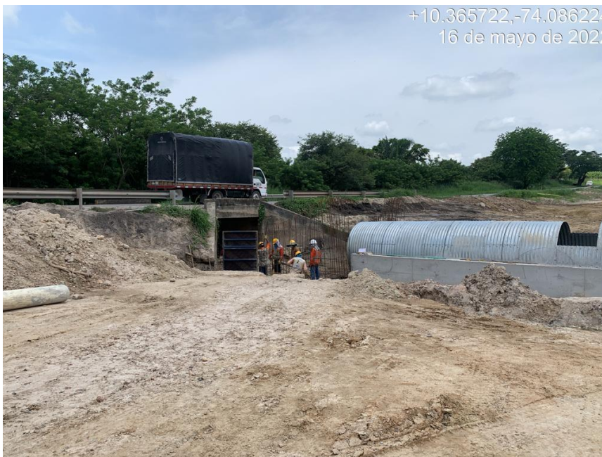
Figura 3. Obra Hidráulica.

Sin otro particular procedemos con el cierre del requerimiento del asunto en nuestro sistema de atención al usuario.